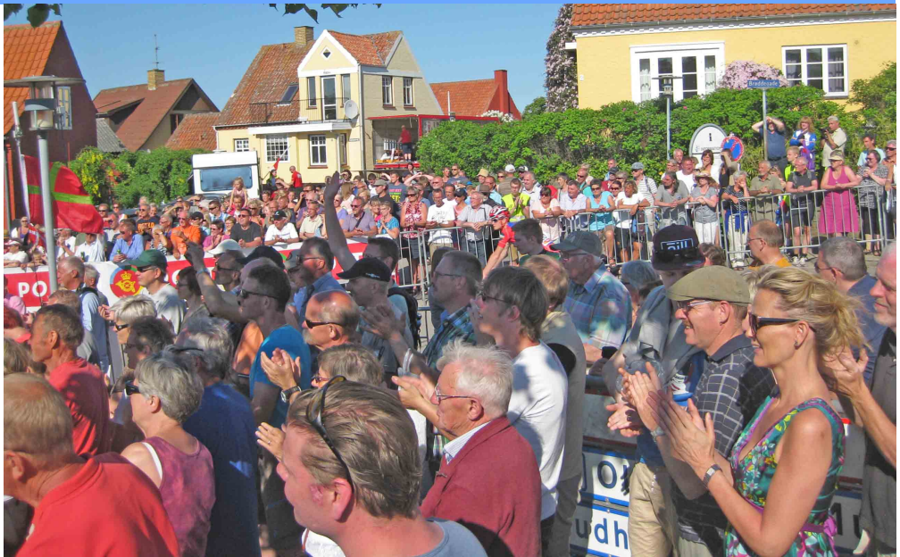
Masser af tilskuere i det flotte sommervejr til både PostCup-løbet samt Bjergløbet.