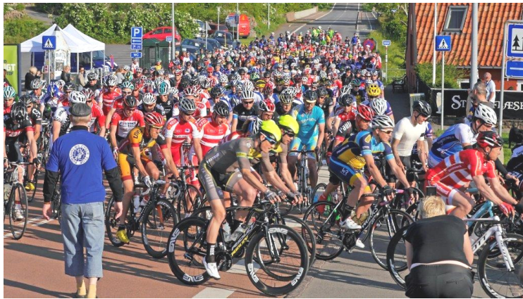
Starten på motionsløbet 2014.